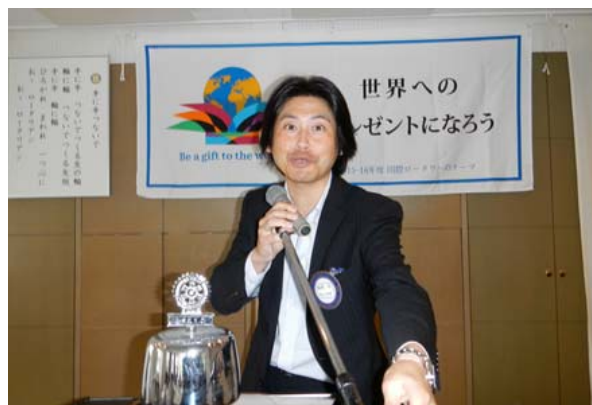
「私の職業」輪湖会員